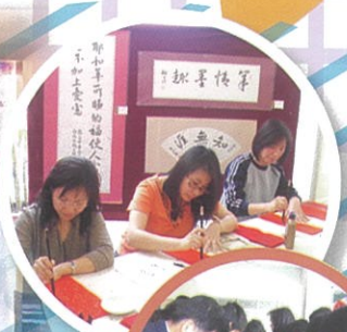
2006-2007 年度 中文雙周活動