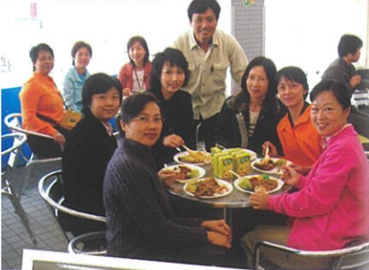
2005-2006 年度 家長新春團拜