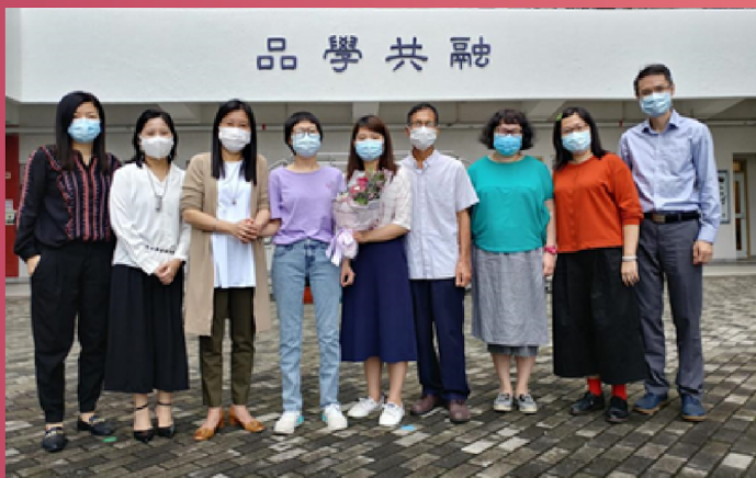
← 筆者與老師、親人合照

我還有許多事情想做、許多地方想去。同時又心有不甘，我也不是十惡不赦的罪人，為何偏偏選中我呢？由於當時情況緊急，醫生也盡快幫我安排了手術，完成手術後住院大概兩個月。手術後的康復也是最讓我感到挑戰的，不僅僅是失去平衡力，活動能力也大不如前，走路跌跌踉踉、視線朦朧。也因為要接受電療，人開始變得懶惰與自負，覺得不需努力，反正也做不了甚麼頭腦不太清醒，所以也沒太大感受。不過，有時中學的老師、同學前來探望，他們探訪時不缺關心，問問身心健康狀況，關懷備至，就似與友伴閒話家常；還有家人的不辭勞苦，每天黃昏時段的探望時間，就算下班後多累，仍堅持來探望我，餵我吃晚飯。想到這些，我也不好埋怨什麼了。