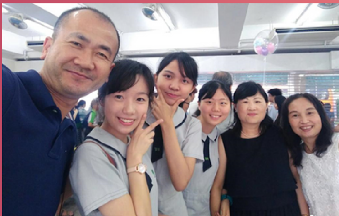
← 筆者與父母、好友的合照