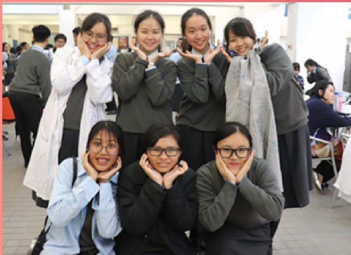
↑ 筆者在last day 與朋友們的合照

挫折，曾讓我一蹶不振。驀然回首，它只是短暫的狂風暴雨，最後總會雨過天晴。只要明白此一道理，我就可以昂首闊步。