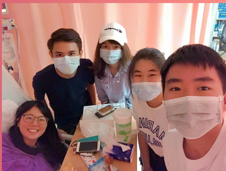
↑ 好友到醫院探望筆者

我還有許多事情想做、許多地方想去。同時又心有不甘，我也不是十惡不赦的罪人，為何偏偏選中我呢？由於當時情況緊急，醫生也盡快幫我安排了手術，完成手術後住院大概兩個月。手術後的康復也是最讓我感到挑戰的，不僅僅是失去平衡力，活動能力也大不如前，走路跌跌踉踉、視線朦朧。也因為要接受電療，人開始變得懶惰與自負，覺得不需努力，反正也做不了甚麼頭腦不太清醒，所以也沒太大感受。不過，有時中學的老師、同學前來探望，他們探訪時不缺關心，問問身心健康狀況，關懷備至，就似與友伴閒話家常；還有家人的不辭勞苦，每天黃昏時段的探望時間，就算下班後多累，仍堅持來探望我，餵我吃晚飯。想到這些，我也不好埋怨什麼了。