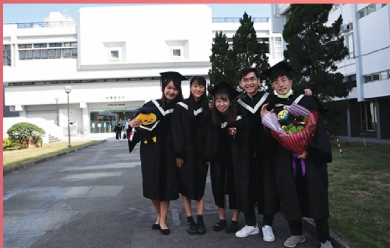
↑ 與藝術系同學在新亞書院錢穆圖書館前留影

從小到大，並沒有經歷什麼大苦大難。曾與家人分隔兩地，八九歲學習照顧自己及弟妹；試過進進出出醫院，總會穿過半截的粉色牆壁，通往病床排排列列的男士病房，爸爸身體不好；曾覺得世界只剩一片黑漆漆，裡裡外外都空無一人；斷斷續續的社運，來勢洶洶的病毒，大學歲月彷彿有始無終；多次陷入無止境的迷思，猶如墜落萬丈深淵.....與其視之為逆境，不如當作成長過程。成長了，你會為自己感到驕傲；成長了，眼裡所見的景致煥然一新，心裡也形成了遊樂園。如果逆境選擇了你，你不要下墜。