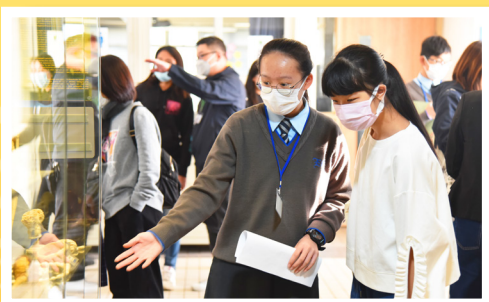
學生大使向參觀者作校園介紹