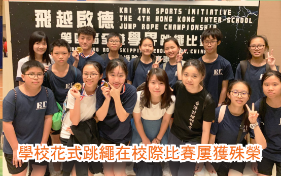
學校花式跳繩在校際比賽屢獲殊榮