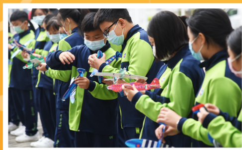
小學訪校參與活動