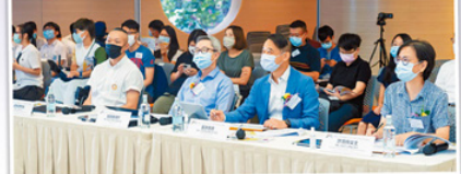
成功找到解決方案 脫穎而出

香港小童群益會與陳廷驊基金會共同策劃的「感創敢為2.0—青年社會創新服務獎」，於本月初已順利舉行頒獎典禮，合共頒發28個獎項，當中順利天主教中學、將軍澳香島中學及風采中學（教育評議會主辦）三間學校的參賽作品脫穎而出，勇奪金獎殊榮，並獲評審團高度評價，未來有機會持續發展項目，為社會帶來改變。