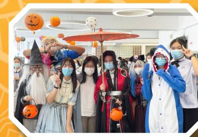
Halloween Fun Fair