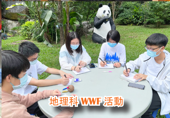
地理科 WWF 活動