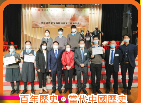
百年歷史 · 當代中國歷史 閱讀報告比賽