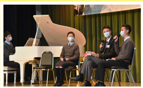
老師與學生談風采的品德教育

Our highly-anticipated admission sessions were successfully held on December 5, 2021 as both sessions were fully booked within two days by more than 750 families of prospective students. The lectures and guided campus tours, only made possible by the generous support of more than 100 student volunteers and alumni, were instrumental in providing an honest view into the characteristics of Elegantians in various aspects and hence highly acclaimed.