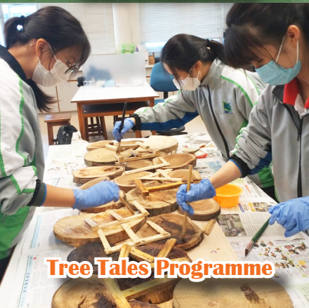
Tree Tales Programme