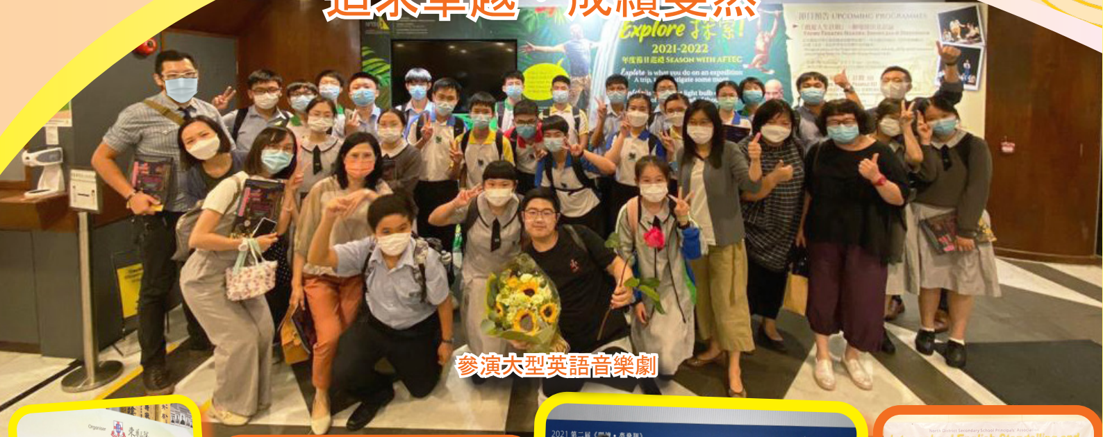
參演大型英語音樂劇