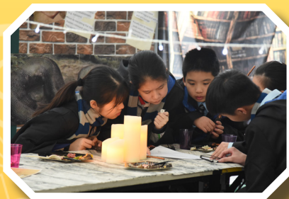
Harry Potter Week