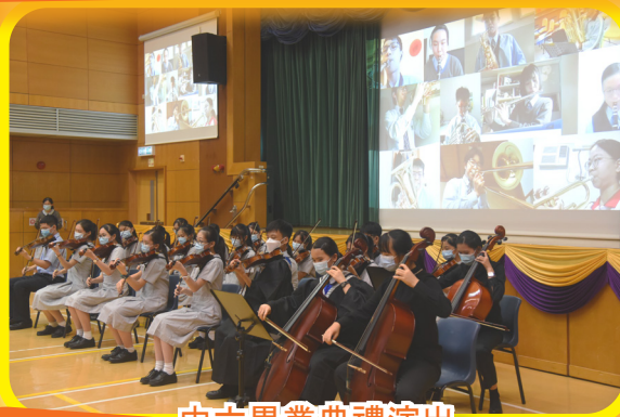
中六畢業典禮演出