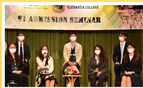
感念母校·校友分享