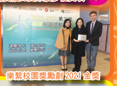
樂繫校園獎勵計劃 2021 金獎