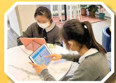
Reading ebooks in Self-activated Interdisciplinary Learning (SAIL) Zone