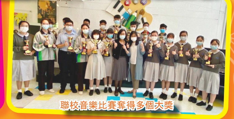
聯校音樂比賽奪得多個大獎