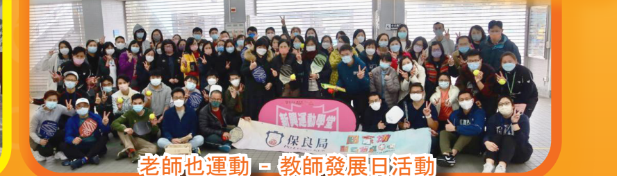
老師也運動 - 教師發展日活動