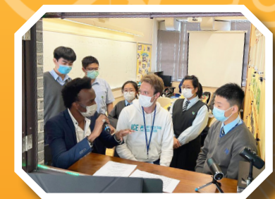
Lunchtime English Radio Programme