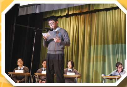
Senior Form Debate