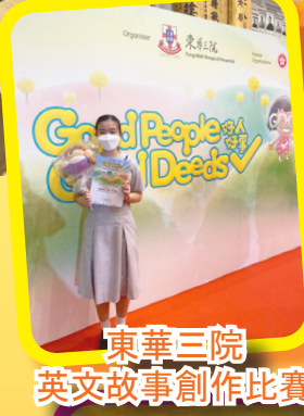
東華三院 英文故事創作比賽