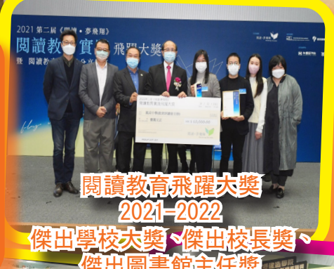
閱讀教育飛躍大獎 2021-2022 傑出學校大獎、傑出校長獎、 傑出圖書館主任獎