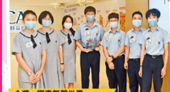
金獎-探索無聲世界

「探索無聲世界」擬解決的問題是一改普遍大眾對弱聽人士存在的誤解，認為佩戴了助聽器的弱聽人士與健聽人士一樣可以口語溝通。因此他們便製作以第一人視角的互動視頻及真人圖書館，讓參加者進行不同體驗遊戲，以了解弱聽人士所面對的生活困難。「我們和弱聽人士傾談後，才得知他們日常面對很多困難，就如到醫院看症，需要到不同的部門職位處理各種手續，但往往因為聽力問題無法清楚聽到廣播訊息，或者錯過醫生姓名，對他們造成很大困難。」因此同學們便決定找出解決方法以教育大眾，讓社會人士更正面面對的困難。他們原本希望製作VR影片，但後來因資金不足改為拍攝短片，幸好效果更理想，因為短片更能將弱聽人士生活的場景呈現出來，且可以加入互動遊戲元素，得到不少人的認同，以及明白到弱聽人士的需求。學校老師稱是次比賽過程中，看見同學們都成長了，除了因為搜集資料而走進社會探究社會議題，激發起他們協助弱聽人士的心，同時因為疫情關係，很多同學們未能聚在一起工作，但他們仍堅持團隊精神，共同參與製作。這一點是他以往看不到的，而同學們也紛紛表示希望持續進行項目，為社會作出貢獻。