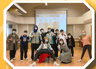
S3 English Drama Elective