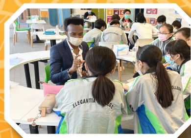
Cross-cultural Communication in Global Awareness Days