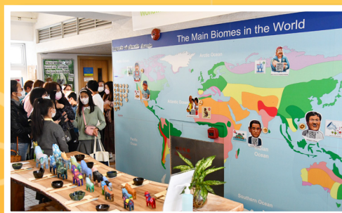
家長及同學在「生態探知館」參觀