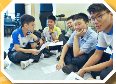
Summer Drama Workshop