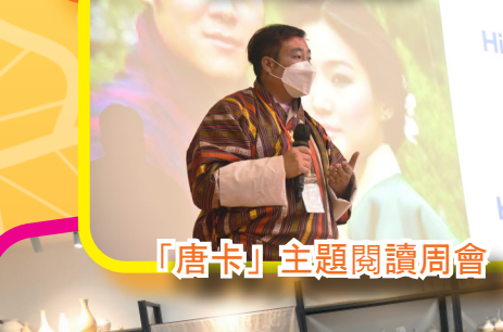
「唐卡」主題閱讀周會