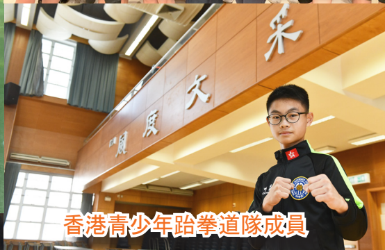
香港青少年跆拳道隊成員