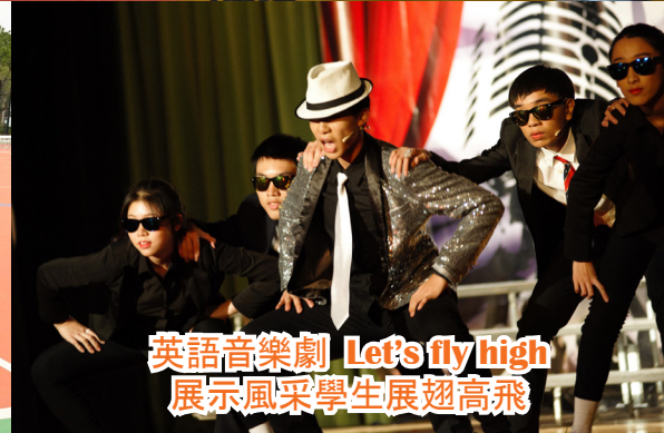
英語音樂劇 Let's fly high 展示風采學生展翅高飛