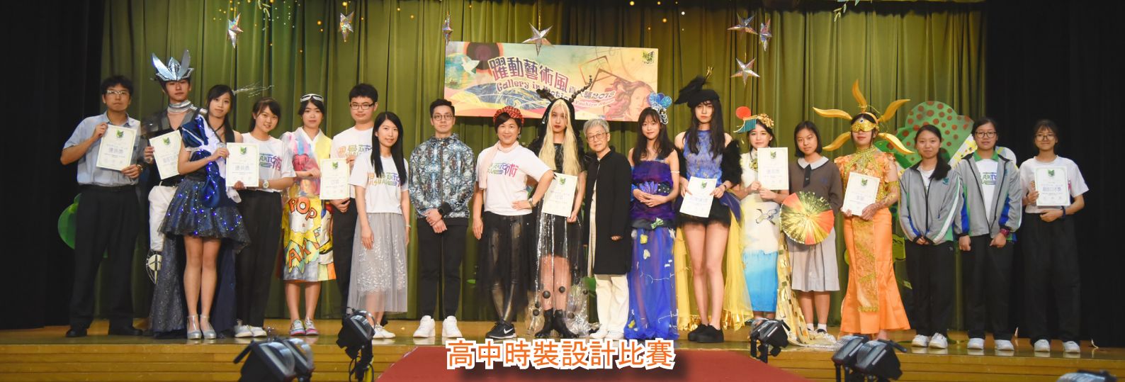
高中時裝設計比賽