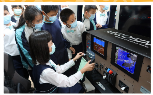
小學訪校體驗校內設施