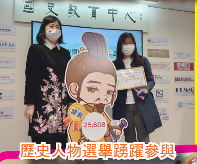
歷史人物選舉踴躍參與