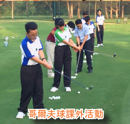
哥爾夫球課外活動