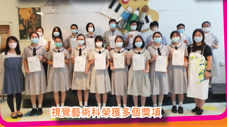
視覺藝術科榮獲多個獎項