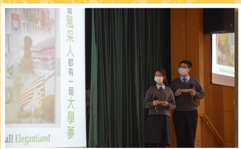
由學習大使分享風采的學與教