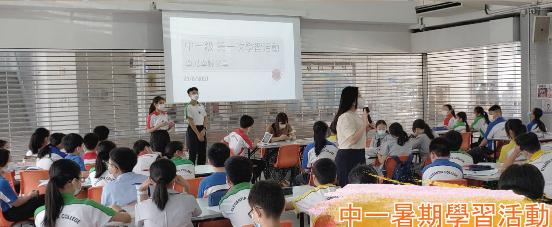
中一暑期學習活動