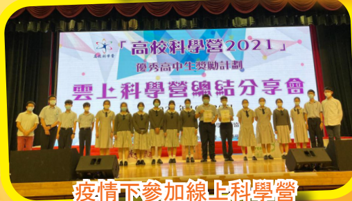
疫情下參加線上科學營