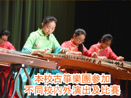
本校古箏樂團參加 不同校內外演出及比賽