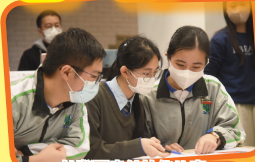
社際圖書館技能比賽