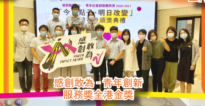
感創敢為 - 青年創新 服務獎全港金獎