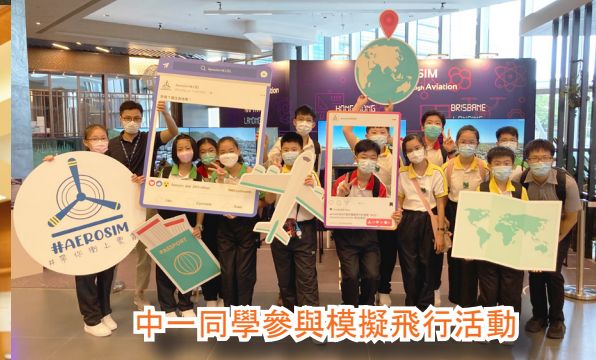
中一同學參與模擬飛行活動