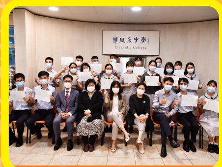
2021 中學文憑試取得優秀成績學生