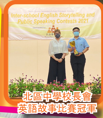
北區中學校長會 英語故事比賽冠軍