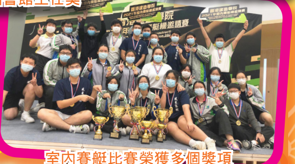
室內賽艇比賽榮獲多個獎項